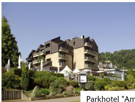
Parkhotel "Am Schänzchen" Konrad Adenauer Allee 1 56626 Andernach www.parkhotel-andernach.de/